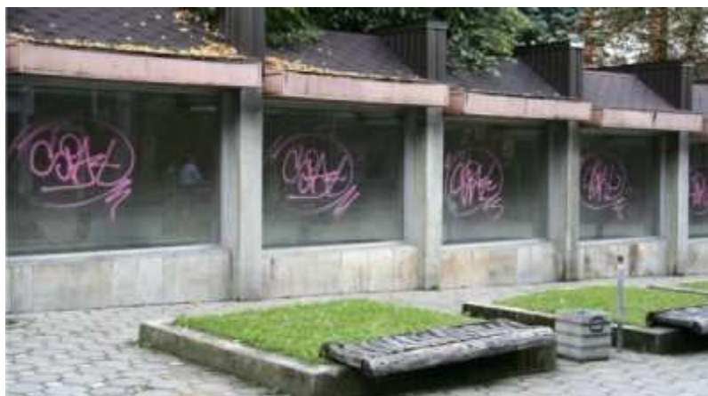
Taip vitrinos atrodė pirmadienį

Visos abejonės išsisklaidė trečiadienio rytą išvydus prie stiklinių vitrinų triūsiančius Šiaulių moksleivių namų darbuotojus. Apipurkšti stiklai buvo nuvalyti, netrukus vitrinose atsirado moksleivių namų auklėtinių darbai.